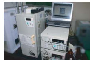
ガスクロマトグラフ質量分析装置 (GC-MS)