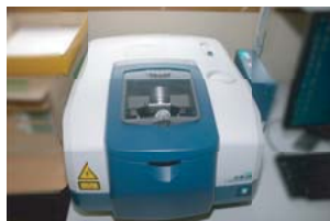
フーリエ変換赤外分光光度計 (FT-IR)