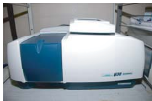
紫外・可視分光光度計