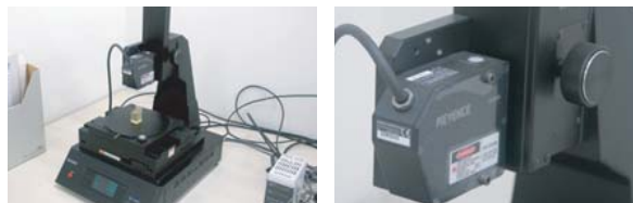
非接触3次元形状計測装置