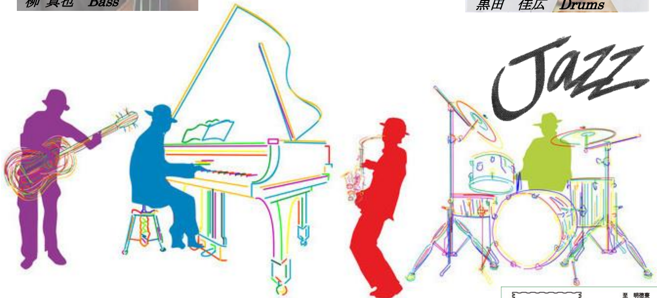
黒田 佳広 Drums